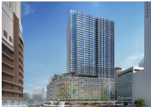
大阪梅田ツインタワーズ・サウス