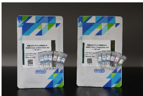
「SARS-CoV-2 Detection Kit」

当社は、最短 60 分以内で新型コロナウイルス(SARS-CoV-2)の抽出と検出・測定が可能な新型コロナウイルス検出キット「SARS-CoV-2 Detection Kit」を開発しました。新型コロナウイルスの治療薬・ワクチン・消毒液など(以下、「治療薬等」)を開発する研究機関向けに本日より販売を開始します。