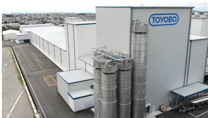
犬山工場に新設した製造設備

当社は、犬山工場(愛知県犬山市)に、液晶ディスプレイ用の超複屈折ポリエステルフィルム「コスモシャイン SRF®」専用の製造設備を新たに建設し、2020 年 7 月より量産を開始しました。