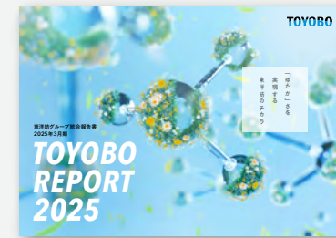
TOYOBO REPORT (統合報告書)