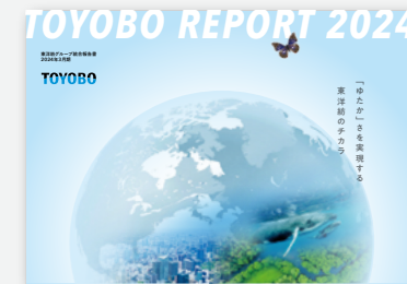
TOYOBO REPORT 🔗 (統合報告書)