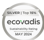
SILVER | Top 15% Sustainability Rating MAY 2024